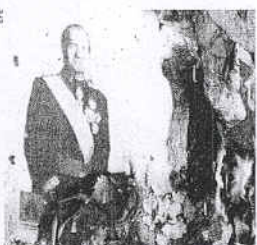
Retrat del Rei en flames ahir a la UAB.