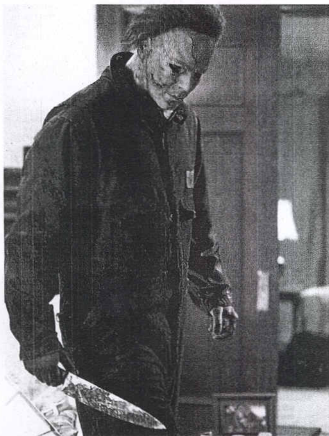
En Sitges se podrá ver un remake de Halloween : sangre y sustos que gustaban en los 70, y ahora.