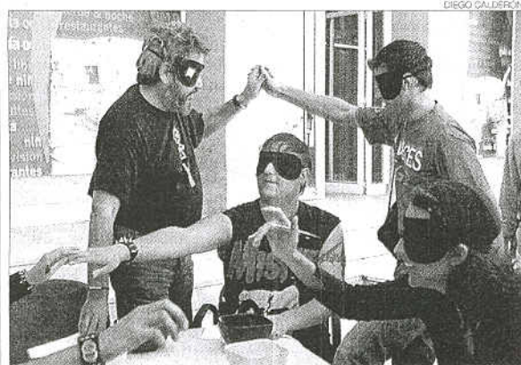
Ejercicios Los participantes, vendados durante un ejercicio.

Un taller organizado por la UAB indaga en los procesos cerebrales que activan el terror